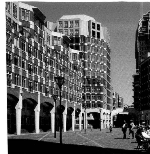
Sopra e in copertina, opere di Adolfo Natalini. In copertina a Novoli, Firenze a pag. 396. Nell'immagine in alto Museo a pag. 392.